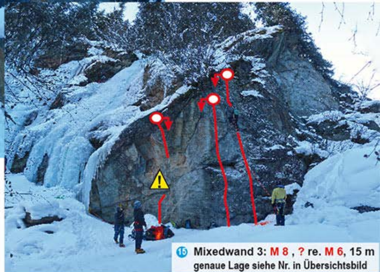
15 Mixedwand 3: M 8 , ? re. M 6 , 15 m genaue Lage siehe Nr. in Übersichtsbild