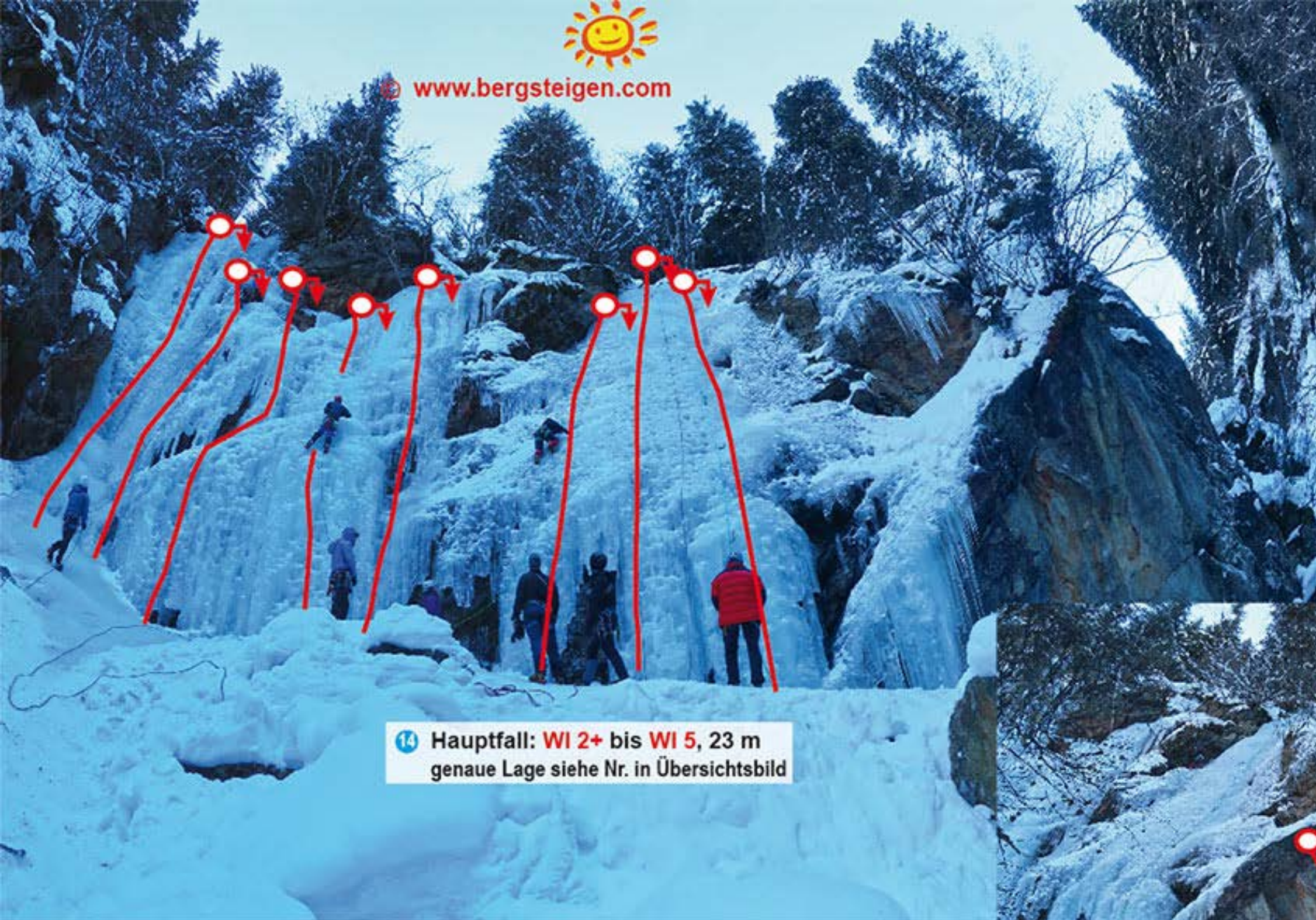
14 Hauptfall: WI 2+ bis WI 5 , 23 m genaue Lage siehe Nr. in Übersichtsbild